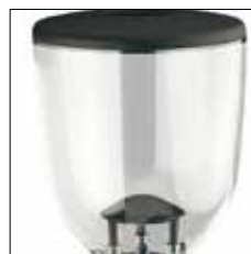
Tolva de 1,7 kg de capacidad.