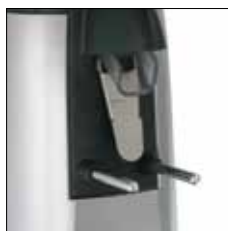
Cuerpo en aluminio