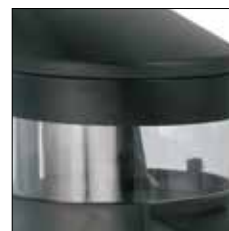
Capacidad café molido: 200 g Regulación: 7-11 g En dosificadores de pie: 300 g