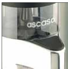
Dosificador + prensa aluminio pulido. (K6/K8/K10)