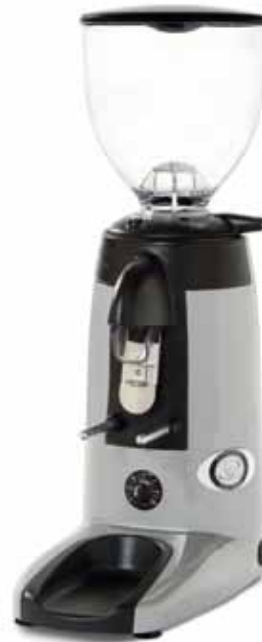
K-3 Touch Advanced

Potencia: 1/3 CV Giros/minuto: 1300 Fresas: 58 Ø Peso: 8,5 kg Ancho/Profundo/alto: 165x305x496 mm