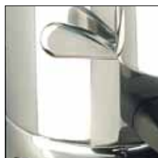
Cuerpo en Aluminio. Aro dosificador aluminio (K8/K10) y plástico (K6)