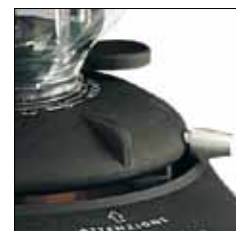
Regulación de molienda micrométrica continua. (K6/K8/K10)