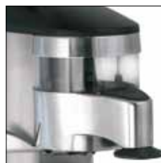
Dosificador + prensa aluminio pulido. (K3 Elite)(A1)