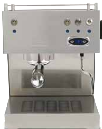
PID (external temperature control)