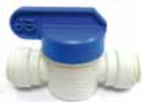
V.6567 13,76 € Grifo de paso Ø 10 mm