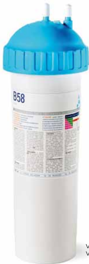
SERIE B58 (Máquinas profesionales de cafés)