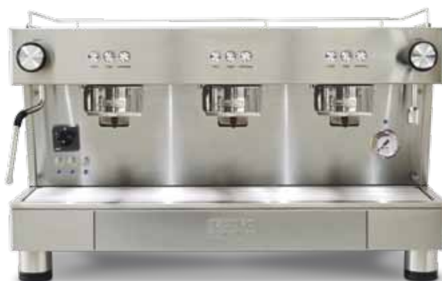
Bar Capsule Auto-ejection 3 GR (70 cm)