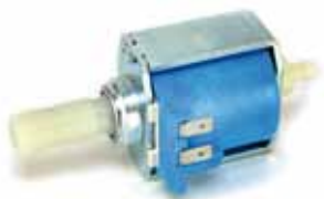
Bomba ARS café 65 W - 20 bar