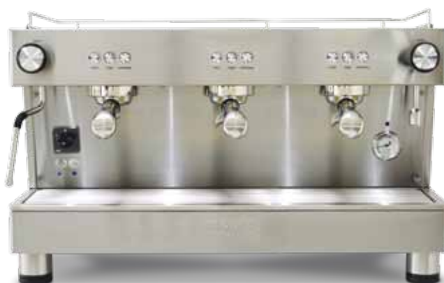
Bar Versatile 3 GR (70 cm)