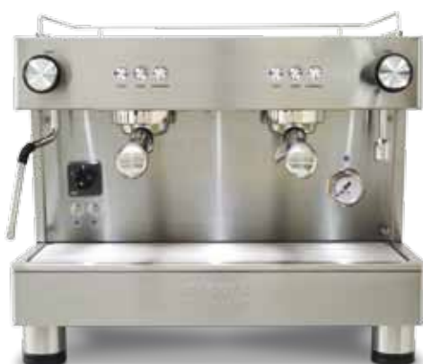
Bar Versatile 2 GR COMPACT (56 cm)