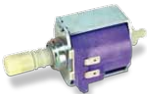
Bomba ARS vapor 35 W - 0,6 L/min

Silenciosas. Auto cebantes. Profesionales.