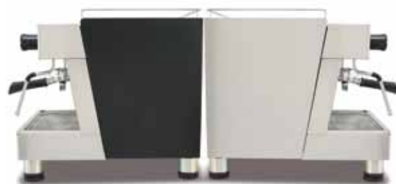
Standard Version (black-inox)