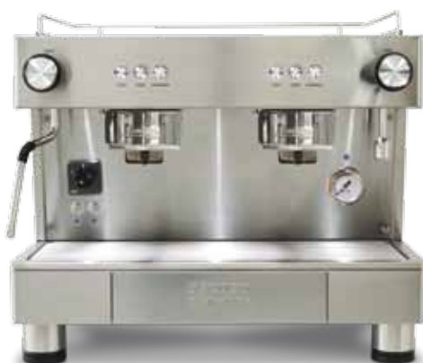
Bar Capsule Auto-ejection 2 GR COMPACT (56 cm)