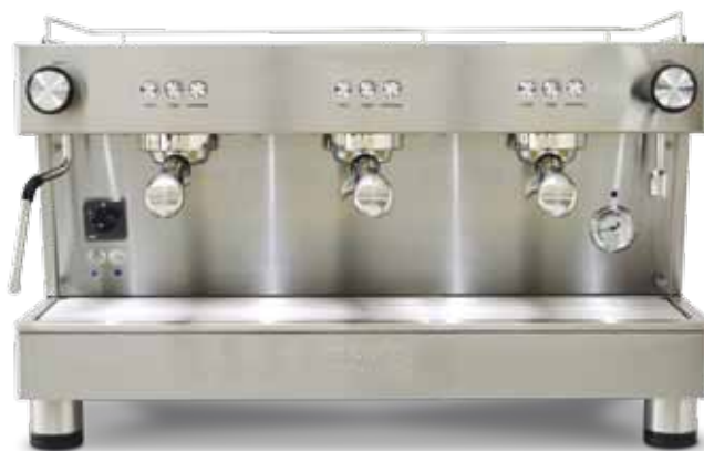
Bar Versatile 3 GR (70 cm)