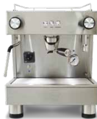
Bar Pod 1 GR (40 cm)