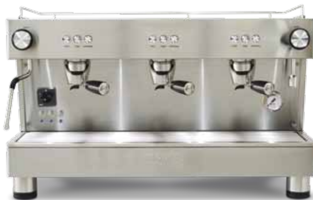
Bar Pod 3 GR (70 cm)