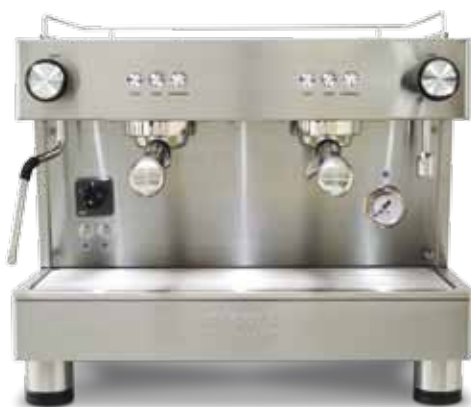
Bar Versatile 2 GR COMPACT (56 cm)