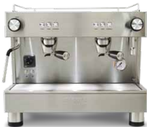
Bar Pod 2 GR COMPACT (56 cm)