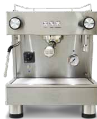
Bar Versatile 1 GR (40 cm)