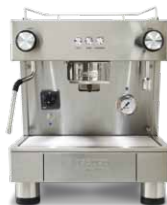
Bar Capsule Auto-ejection 1 GR (40 cm)

Cajón cápsulas desechables. 50 u. Avisador acústico.