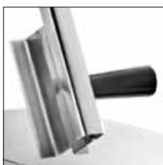
Empujacarne de aluminio pulido.