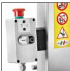
Pulsador de emergencia. Microinterruptor en la tapa de cierre.