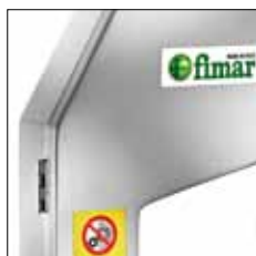
Estructura de aluminio anodizado. Sierra para hueso en dotación.