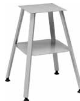
Caballete acero barnizado opcional. 550x570x700h

Potencia: 1 Hp - 750 W Voltaje: 230 V / 1N / 50 Hz Desarrollo sierra: 1830 mm Corte útil: 200 x 225 mm Plano de trabajo: 410x410 Ancho/Profundo/Alto: 630x450x970 Peso: 39 kg