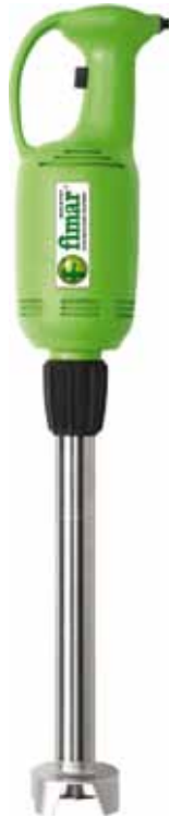
BTA.4 368 € Brazo triturador 40 cm