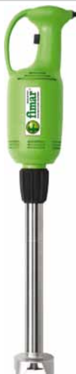
BTA.4 368 € Brazo triturador 40 cm