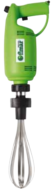
BTA.18 452 € Variador Brazo batidor