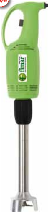
BTA.1 302 € Brazo triturador 30 cm