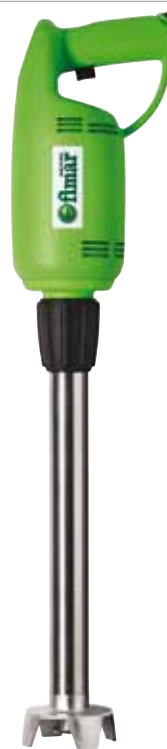
BTA.17 368 € Brazo triturador 40 cm