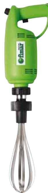
BTA.18 452 € Variador Brazo batidor