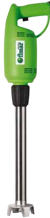
BTA.17 368 € Brazo triturador 40 cm