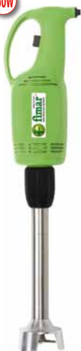
BTA.1 302 € Brazo triturador 30 cm