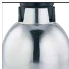
Estructura de aluminio. 2 velocidades, más impulso.