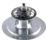
CEA.47 99 € Disco mezclador para modelos BTC.1/2/3/4/5/7/8