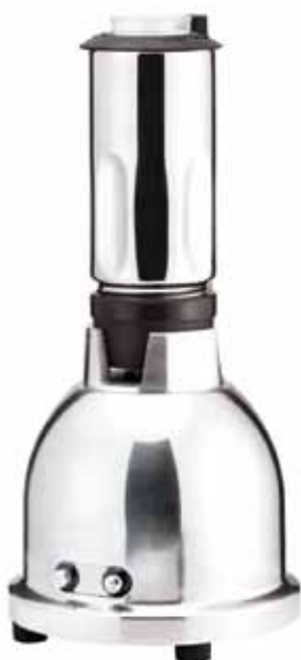
BTC.2 Especial cócteles.