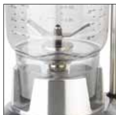
Vaso patentado para bebidas a base de hielo.

Los vasos solo son compatibles con los códigos indicados.