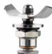
BTC.116 93,72 € Cuchilla para BTC.9