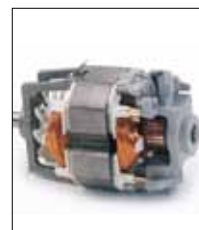
Motor universal ventilado. 300 W.