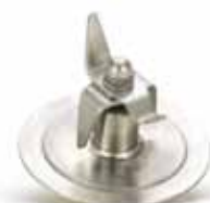
BTC.110 110,68 € Dispositivo de bloqueo de las cuchillas para modelos BTC.1/2/3/4/5/7/8

Los vasos solo son compatibles con los códigos indicados.