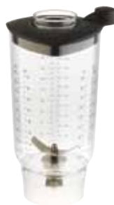
BTC.113 (0,9 l) Vaso con cuchilla para BTC.9 217,80 €