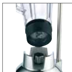
Juntas de acoplamiento de metal y goma/metal.