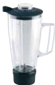
BTC.103 (1,5 l) (para BTC.3/5/8) 160 €