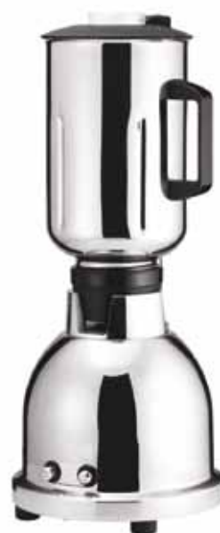
BTC.7 Especial salsas vegetales y frutas.