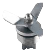
BTC.111 Dispositivo de bloqueo de las cuchillas para BTC.6