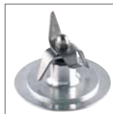
Cuchillas inox con dispositivo de bloqueo.