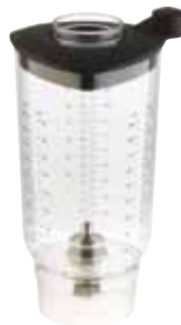
BTC.114 (0,9 l) Vaso con agitador para BTC.9 217,80 €