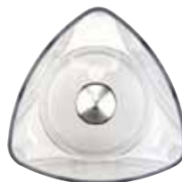
BTC.115 74,16 € Disco mezclador para BTC.9