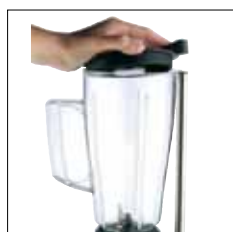
Dispositivo de desconexión magnético en la tapa.

Los vasos solo son compatibles con los códigos indicados.