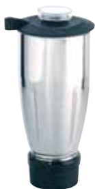
BTC.104 (1,5 l) (para BTC.4) 210 €