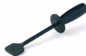
BTC.112 Agitador hielo para BTC.6