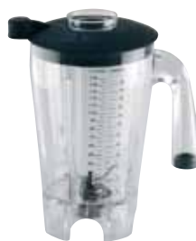
BTC.106 (1,5 l) Para BTC.6