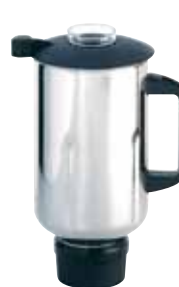
BTC.107 (2,5 l) Para BTC.7 308 €