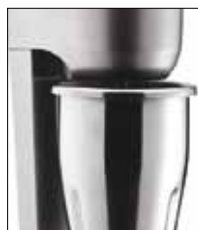
Estructura de aluminio y acero inoxidable.