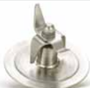
BTC.110 110,68 € Dispositivo de bloqueo de las cuchillas para modelos BTC.1/2/3/4/5/7/8