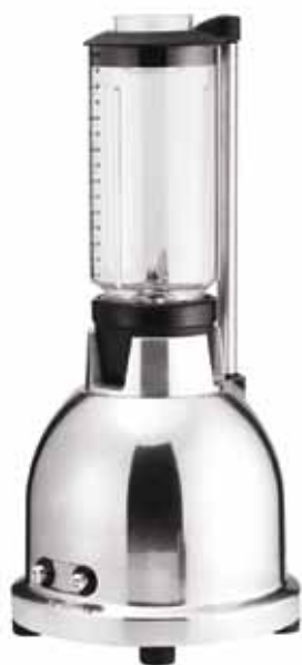
BTC.1 Especial cócteles.