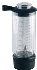
BTC.101 (0,9 l) Para BTC.1 136 €