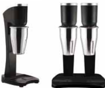
Modelos en color negro. (Bajo pedido)