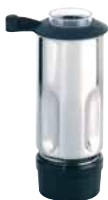
BTC.102 (0,9 l) Para BTC.2 215,60 €