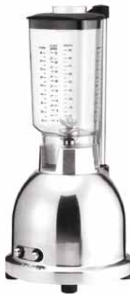
BTC.9 Especial batidos y granizados.