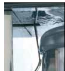
Accionamiento con microinterruptor de seguridad.