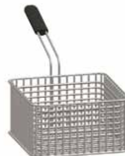
AT.997 130,24 €

Potencia: 16 kW Voltaje: 400 V / 3N / 50 Hz Capacidad: 10 l + 10 l Temperatura: 100-190 °C Ancho/Profundo/Alto: 800x700x850 mm Peso: 45 kg · No lleva cestas en dotación.