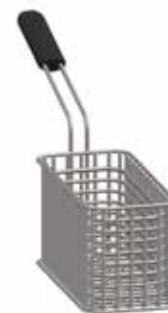
AT.648 100 €

Potencia: 24 kW Capacidad: 12 l + 12 l Temperatura: 100-190 °C Ancho/Profundo/Alto: 800x700x850 mm Peso: 52 kg · No lleva cestas en dotación.