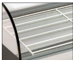
Vitrinas disponibles con bandeja plana.

● Nogal ○ Blanco ● Inox (P) Personalizado (10) Bandejas