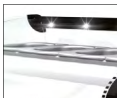
Iluminación LED impermeable.